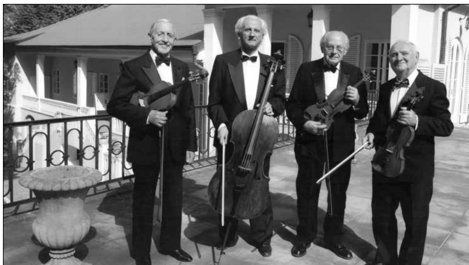
foto Smyčcové kvarteto AQUARIUS