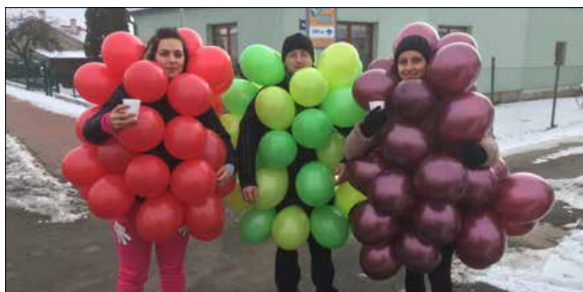
Masopust 2018