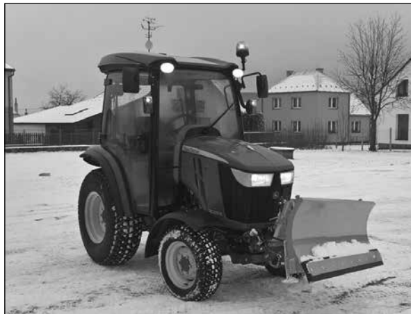
JOHN DEERE 3038 R