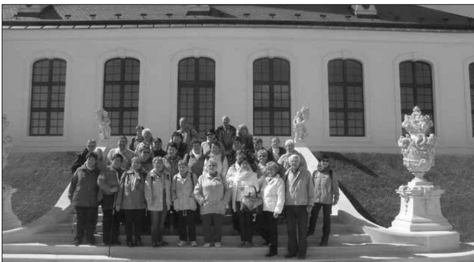
Zájezd do Bratislavy, foto: Alois Sedlák

Moc děkují aktivní senioři z Protivanova a Malého Hradiska.