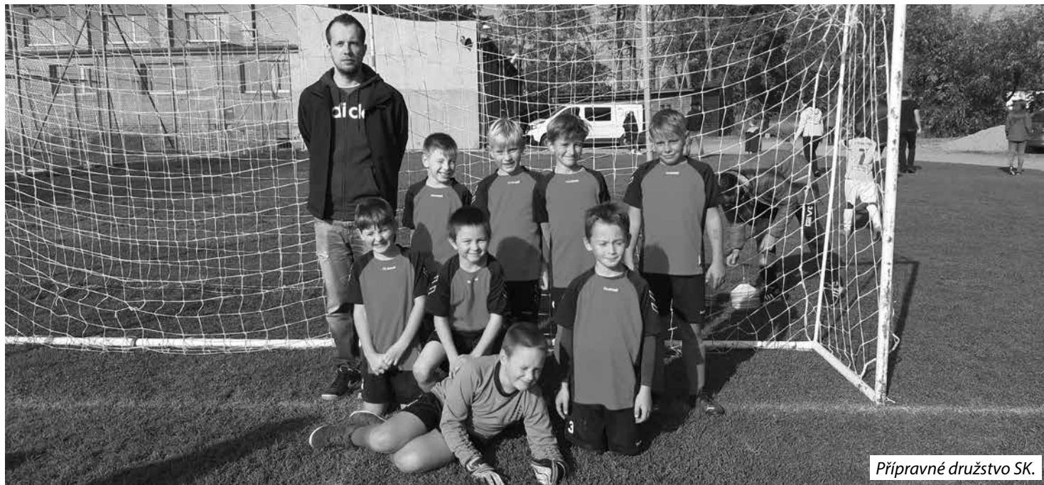
Přípravné družstvo SK.