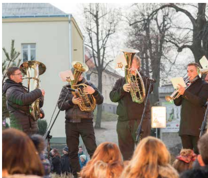
Rozsvícení vánočního stromu na Náměstí