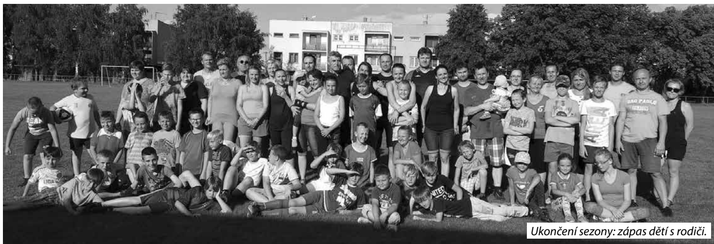
Ukončení sezony: zápas dětí s rodiči.