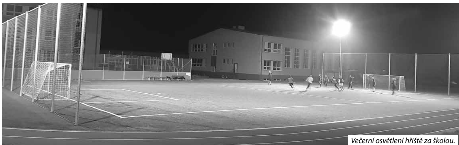
Večerní osvětlení hřiště za školou.